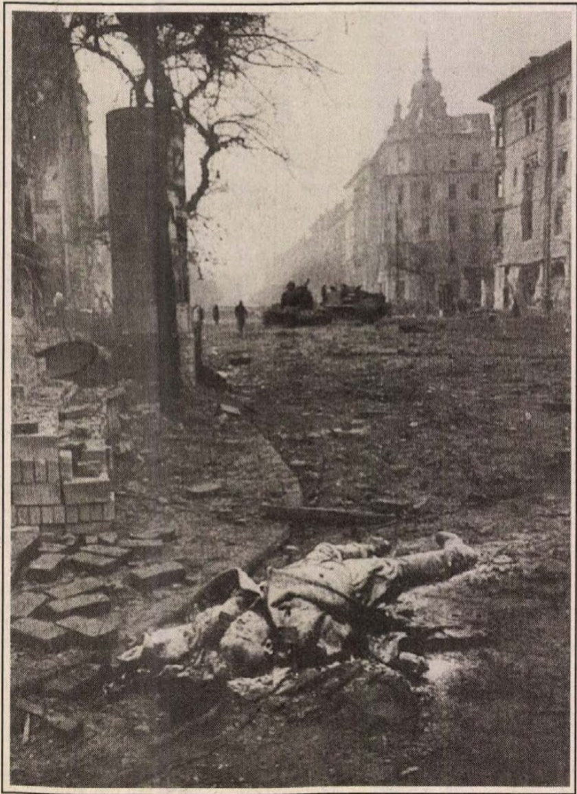
Az egyik fontos színhely: az Üllői út a Kilián laktanyánál